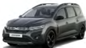
SIVÁ COMÈTE (1)