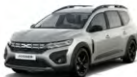
SIVÁ MOONSTONE (1)