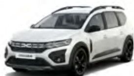
BIELA GLACIER (2)

* Mapové podklady pre strednú a východnú Európu, 6 aktualizácií po dobu 3 rokov.