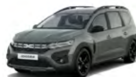
SIVÁ DUSTY (2)