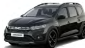
ČIERNÁ NACRÉ (1)