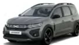
SIVÁ URBAN (2)