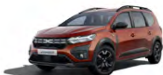
HNEDÁ TERRACOTTA (1)