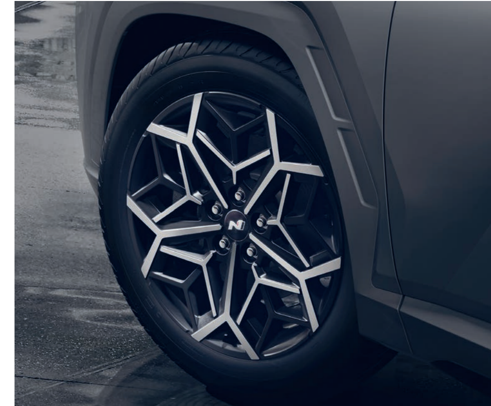
Energické a športové 19-palcové disky z ľahkej zliatiny pokračujú v téme zmyselnej športovosti parametrickým vzorom, zvýrazňujúcim ich geometrickú štruktúru.