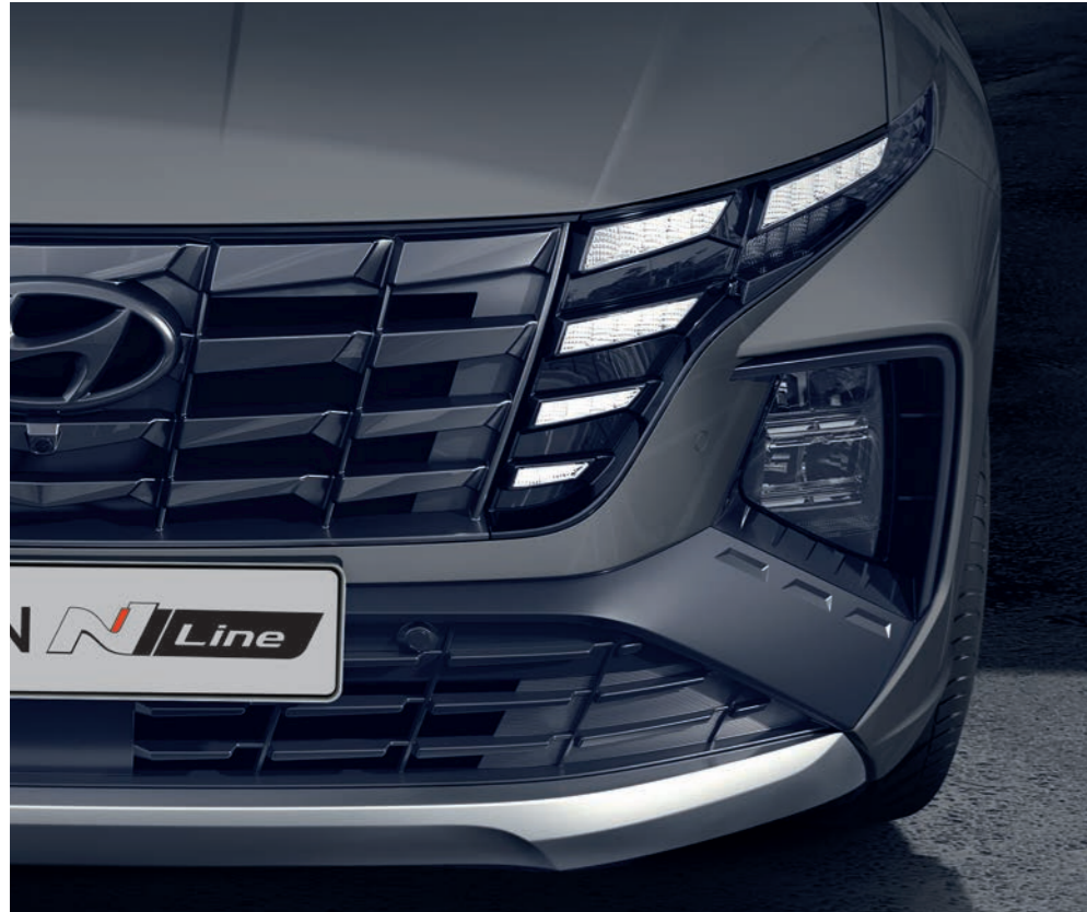
Širší, hranatý nárazník N Line so zväčšenými vstupnými otvormi vzduchu je nápadným prvkom prednej časti karosérie.

Dizajnéri zvýraznili stabilný, široký postoj modelu TUCSON N Line posunutím masky chladiča a dizajnových prvkov na nárazníkoch ďalej do bokov pre horizontálne orientovaný, atletický vzhľad. Širšia maska chladiča N Line s lichobežníkovým dizajnom nesie logo N Line, svetlomety majú čiernu obrubu.