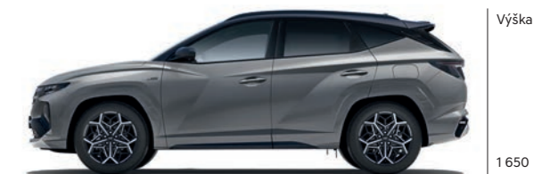
Dĺžka Rázvor 4 510 2 680 Výška 1 650