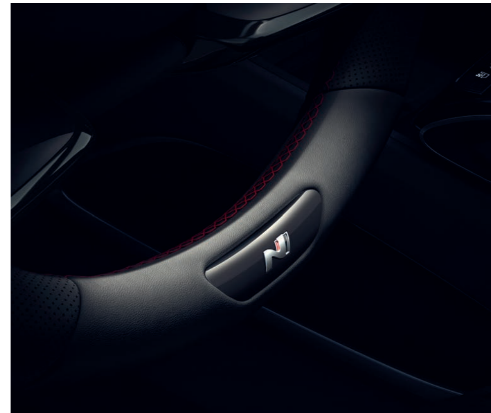
Športový volant N Line s metalickými ramenami, potiahnutý jemnou kožou s červeným kontrastným prešívaním, hrdo nesie logo N.

Vitajte na úplne novej úrovni precíznosti. Usadte sa do modifikovaného kokpitu úplne nového modelu TUCSON N Line a okamžite pocítite jeho elegantnú, profesionálnu atmosféru. Športové sedadlá N Line sú potiahnuté luxusnou kombináciou perforovaného umelého semišu a kože. Sú opatrené logom N a červeným kontrastným prešívaním, ktoré sa opakuje aj na obložení dverí a laktovej opierke. Ďalšie dizajnové prvky N možno nájsť na koženej hlavici radiacej páky alebo kryte konzoly s tlačidlami jazdného režimu shift-by-wire – podľa zvolenej prevodovky. Osobitý športový nádych dodáva interiéru čierny strop kabíny. Ďalšie špecifické prvky N predstavujú kovové pedále, opierka ľavej nohy a dekoratívne obklady na prahoch dverí.