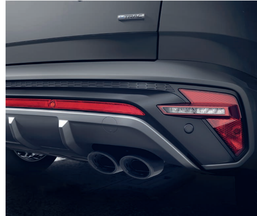
Zadný nárazník so športovou dvojitou koncovkou výfuku zospodu uzatvára strieborný nájazdový štít, akcentovaný červeným reflexným pásom.