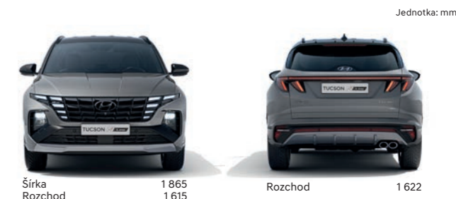
Šírka Rozchod 1 865 1 615 Rozchod 1 622

Spoločnosť HYUNDAI MOTOR CZECH s. r. o., organizačná zložka Slovakia, si vyhradzuje právo na zmeny údajov bez predchádzajúceho upozornenia a bez akýchkoľvek záväzkov, ktoré by mohli z takýchto zmien vzniknúť.