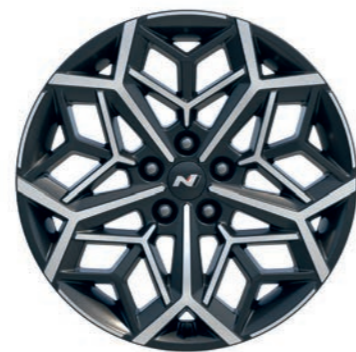
19" disky z ľahkej zliatiny

Úplne nový TUCSON N Line je vybavený špecifickými 19" diskami z ľahkej zliatiny. Pôsobia energicky a športovo, parametrický vzor zvýrazňuje ich geometrickú štruktúru v duchu témy zmyselnej športovosti.