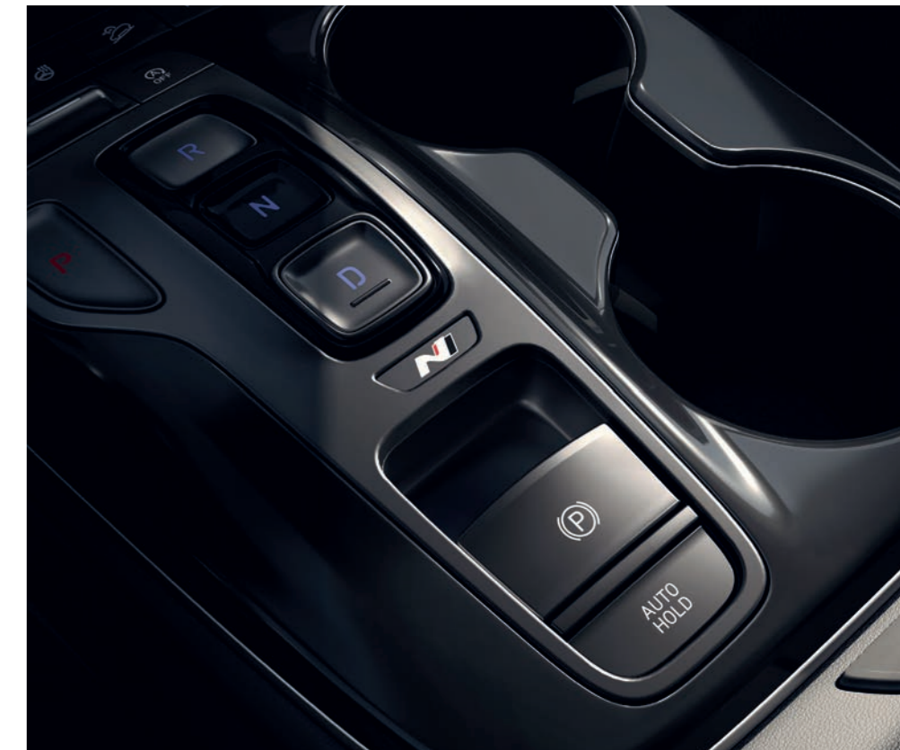
Logo N je aj na elegantnom kryte konzoly shift-by-wire na stredovej konzole.