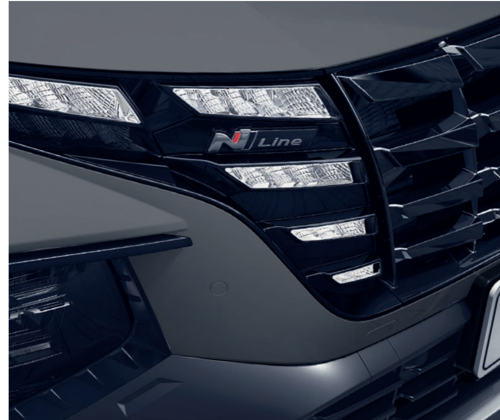
Parametrický vzor masky chladiča N Line bol doplnený dynamickým zakončením na bokoch, vytvárajúcim ďalšie reflexie.