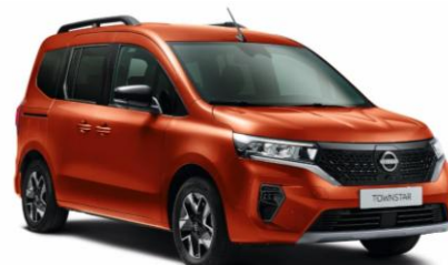
Oranžová Terracotta CNZ – 600 €