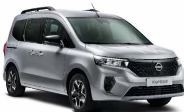
Sivá Pearl KQA – 600 €