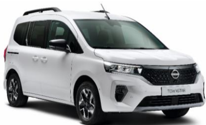
Biela Mineral QNG (bez príplatku)