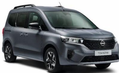
Sivá Urban KPW – 300 €