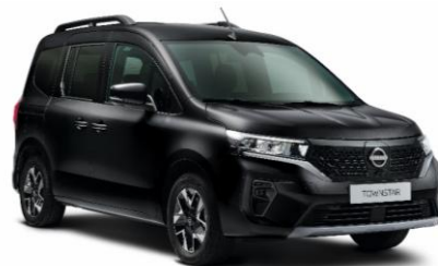
Čierna Enigma GNE – 600 €