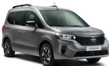
Sivá Casiopee KNG – 600 €