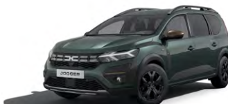
ZELENÁ ČĎDRE (1)