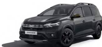
ČIERNA NACRÉ (1)