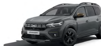
SIVÁ URBAN (2)