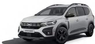
BIELA GLACIER (2)