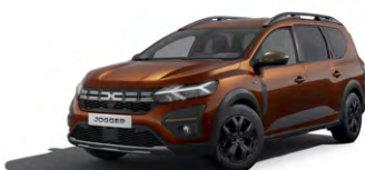
HNEDÁ TERRACOTTA (1)