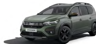
ZELENÁ DUSTY (2)