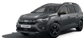
SIVÁ SCHISTE (2)