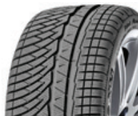
Michelin Pilot Alpin