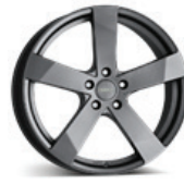
Dezent TD Graphite