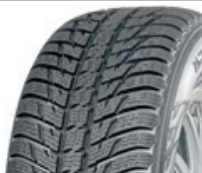
Nokian WR SUV