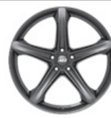
AEZ Yacht dark