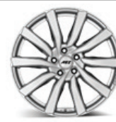
AEZ Reef SI

* Ponuka platí od 1.1.2018 do 28.2.2018 alebo do vypredania zásob u participujúcich partnerov Renault. Prezutie v cene vozidla platí pri kúpe sady 4 ks pneumatík Nokia, Fulda, BFGoodrich, Goodyear, Dunlop alebo Michelin, zahŕňa prácu a drobný materiál (ventilky, závažia) okrem prípadných nákladov spojených s nutnosťou použitia snímača pre systém stálej kontroly tlaku v pneumatikách (TPMS). Pri kúpe sady 4 ks kompletov plechových diskov s vyššie uvedenými značkami pneumatík je platná ponuka ozdobných krytov kolies v cene vozidla. Dostupnosť a cena diskov z ľahkej zliatiny sa môže líšiť podľa motorizácie Vášho vozidla. Kompletnú ponuku diskov z ľahkej zliatiny získate u svojho predajcu.