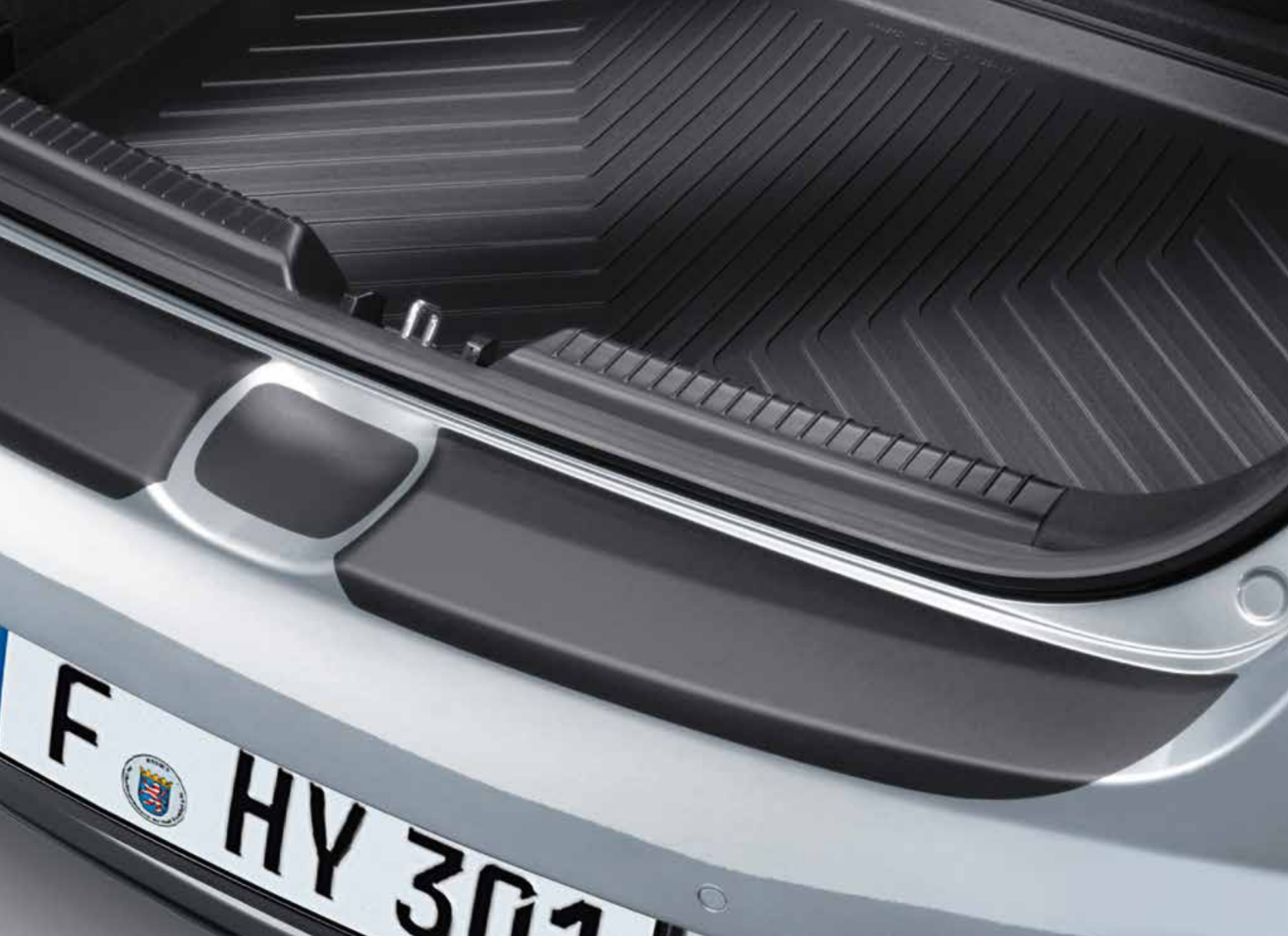
Ochranná fólia zadného nárazníka, čierna. Čierna ochranná fólia vyrobená na mieru, určená na ochranu horného povrchu zadného nárazníka vášho vozidla. Zabraňuje poškodeniu náteru počas nakladania a vykladania. A6272ADE00BL (5-dv. + 3-dv.), A6272ADE01BL (kombi, len model MY12)