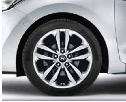
Súprava 17" zliatinového disku. 17" zliatinový disk s desiatimi lúčmi, strieborný, 7,0J x 17, vhodný pre pneumatiky 225/45 R17. Súprava obsahuje puklicu a päť matic. A5F40AC850 (5-dv. + 3-dv. + kombi)