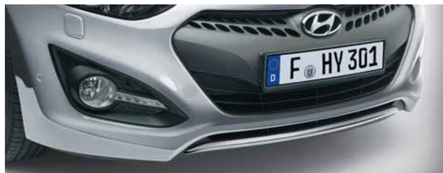
Ozdobná lišta na predný nárazník. Prispôbte čelný vzhľad vášho vozidla i30 pomocou tejto lišty z nehrdzavejúcej ocele s vysokým leskom, ktorá sa upevňuje na predný nárazník. A6494ADE00ST (3-dv., len MY12)