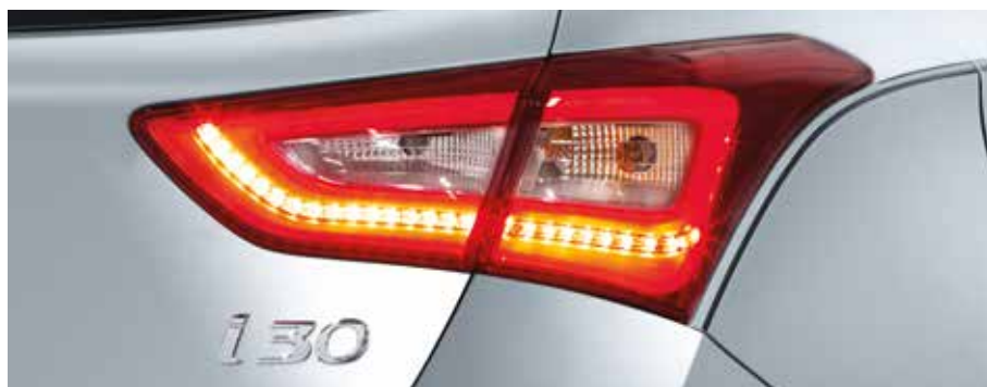
Zadné svetlá s LED prvkami. Tieto atraktívne zadné LED svetlá zvýrazia dynamický štýl modelu i30 v noci. A5F54AC000 (5-dv. + 3-dv.)