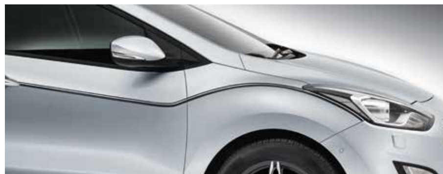
Ozdobné polepy na karosériu „Sporty“. Tieto charakteristické štýlové polepy karosérie zvýrazia plynulé línie a ostré hrany vášho vozidla i30. A6200ADE00BL (čierne, 5-dv.), A6200ADE00WH (biele, 5-dv.)