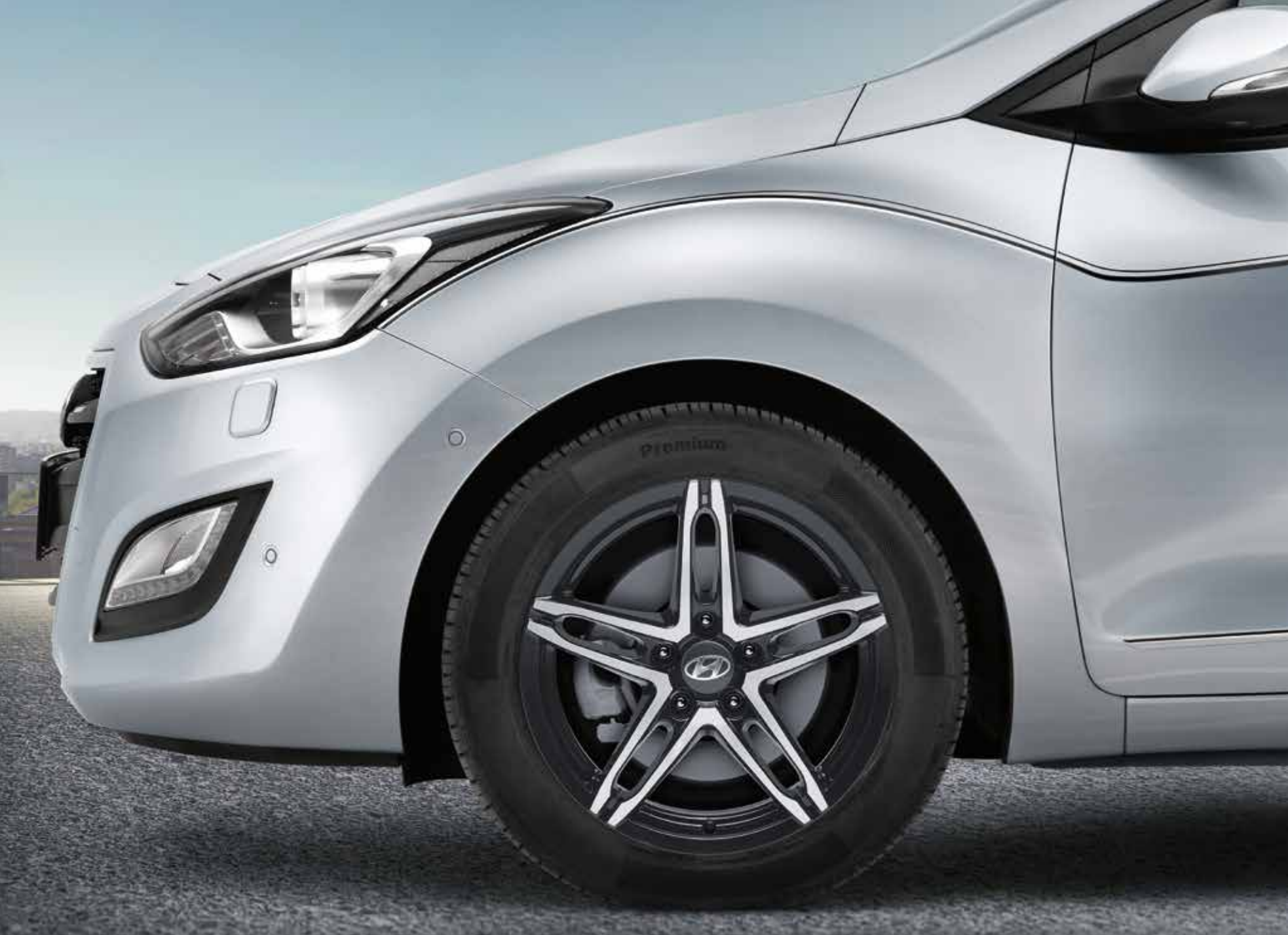
Dvojfarebný 17" zliatinový disk Sohari. Působivý 17" zliatinový disk s 5 dvojitými lúčmi. Vhodný pre pneumatiky 225 / 45 R17. A6400ADE05 (5-dv. + 3-dv. + kombi)