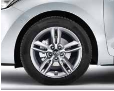
Súprava 18" zliatinového disku. 18" zliatinový disk s charakteristickými piatimi dvojitými lúčmi, 7,5J x 18, vhodný pre pneumatiky 225/40 R18. Súprava obsahuje puklicu a päť matic. Vhodný len pre verziu Turbo. A6F40AC600 (Turbo 5-dv. + Turbo 3-dv., len model MY15)

Neďá sa poprieť, že váš výber diskov vyzdvihne vašu osobnosť v novom modeli i30. Vyberte si z nášho radu originálnych diskov Hyundai, ktoré padnú ako uliate a sú zaručene kvalitné.