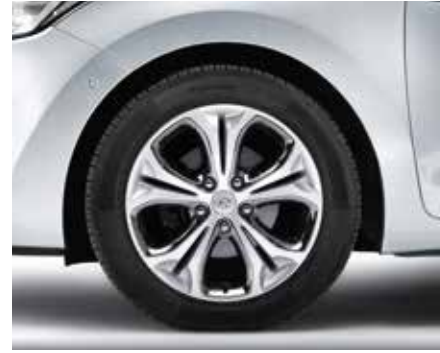
Súprava 17" zliatinového disku. Výrazný 17" zliatinový disk s 5 dvojitými lúčmi s leštenými chrómovými vložkami. 7,0Jx17, typ B, vhodné pre pneumatiky 225/45 R17. Súprava obsahuje puklicu a päť matic. A5F40AC550 (5-dv. + 3-dv. + kombi)