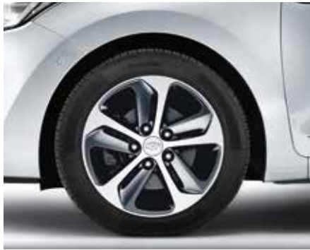
Súprava 16" zliatinového disku. 16" zliatinový disk s piatimi lúčmi, dvojfarebný, 6,5Jx16, vhodný pre pneumatiky 205/55 R16. Súprava obsahuje puklicu a päť matic. A5F40AC700 (5-dv. + 3-dv. + kombi)