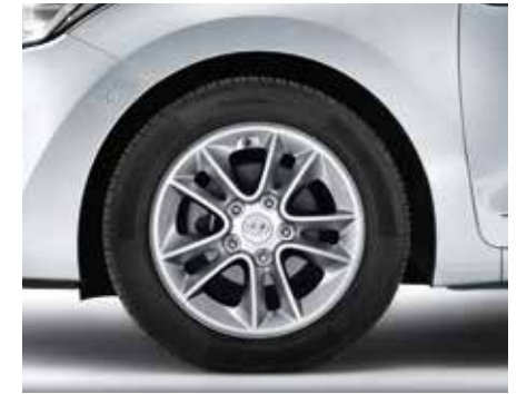
Súprava 15" zliatinového disku. Dynamický 15" zliatinový disk s 5 dvojitými lúčmi, 6,0Jx15, typ A, vhodný pre pneumatiky 195/65 R15. Len pre vozidlá originálne dodávané s 15" diskami. Nie je vhodný pre vozidlá s elektronickou parkovacou brzdou. A5F40AC150 (5-dv. + 3-dv. + kombi)

TPMS – Systém monitorovania tlaku v pneumatikách Tieto originálne snímače sú totožné so snímačmi osadenými pri výrobe, čím zaručia optimálnu funkčnosť a dlhú životnosť batérie snímača. Súprava obsahuje 4 snímače a 4 matice. 3NF40AC000 (5-dv. + 3-dv. + kombi)