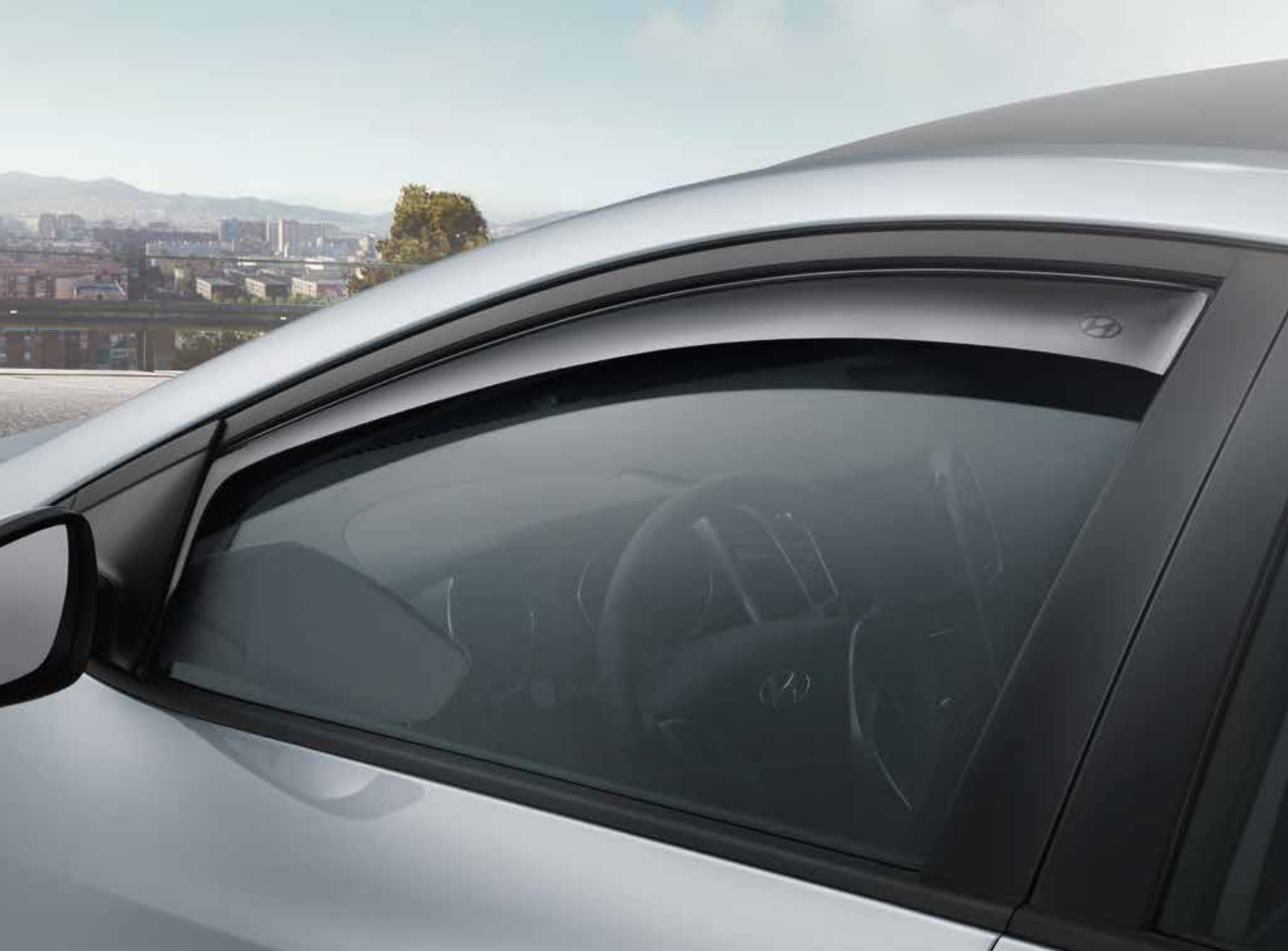
Deflektory okien, predné. Obmedzuje turbulencie počas jazdy s mierne pootvoreným predným oknom. Aerodynamicky tvarovaný deflektor presmerováva tok vzduchu a odráža dažďové kvapky. Súprava 2 ks. A6221ADE00 (5-dv. + kombi + Turbo 5-dv.), A6221ADE01 (3-dv., len model MY12)