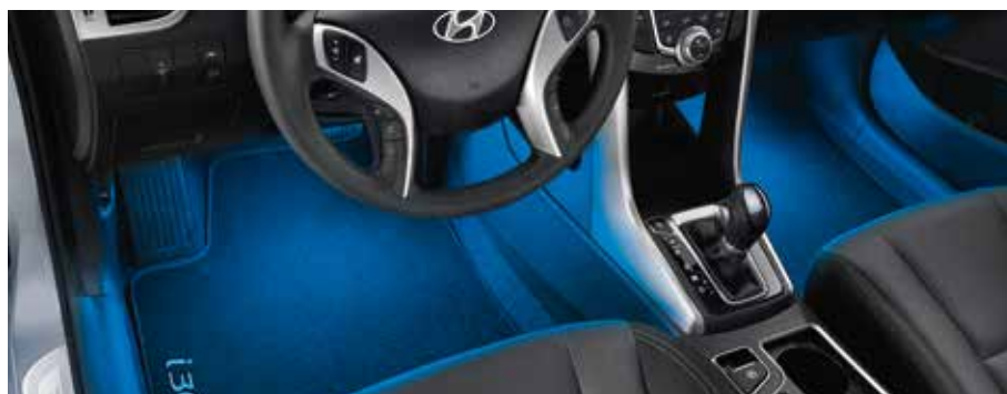
Modré LED osvetlenie priestoru pre nohy. 99650ADE00 (prvý rad, 5-dv. + 3-dv. + kombi + Turbo 5-dv. + Turbo 3-dv.), 99650ADE10 (druhý rad, 5-dv. + 3-dv. + kombi + Turbo 5-dv. + Turbo 3-dv.)