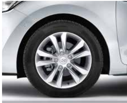
Súprava 16" zliatinového disku. Športový 16" zliatinový disk s 5 dvojitými lúčmi, 6,5Jx16, typ A, vhodný pre pneumatiky 205/55 R16. Súprava obsahuje puklicu a päť matic. A5F40AC350 (5-dv. + 3-dv. + kombi)