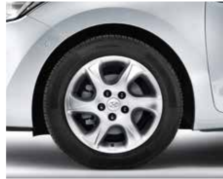
Strieborný 15" zliatinový disk Jindo. Klasický 15" zliatinový disk so 6 lúčmi. 6,0Jx15, vhodný pre pneumatiky 195/65 R15. Len pre vozidlá originálne dodávané s 15" diskami A6400ADE01 (5-dv. + 3-dv. + kombi)

15" oceľový disk. Vhodný pre pneumatiky 195/65 R15. Ideálny pre použitie pri zimných pneumatikách. Len pre vozidlá s manuálnou ručnou brzdou. 52910A6050PAC (5-dv. + 3-dv. + kombi)