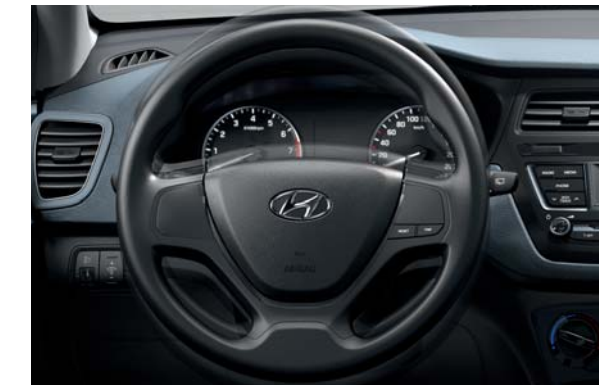
Nastaviteľný volant. Volant sa dá nastavovať výškovo aj pozdĺžne.

Pozrite sa na stranu 33 na kompletný prehľad farebných kombinácií karosérie a interiéru, ktoré sú k dispozícii.