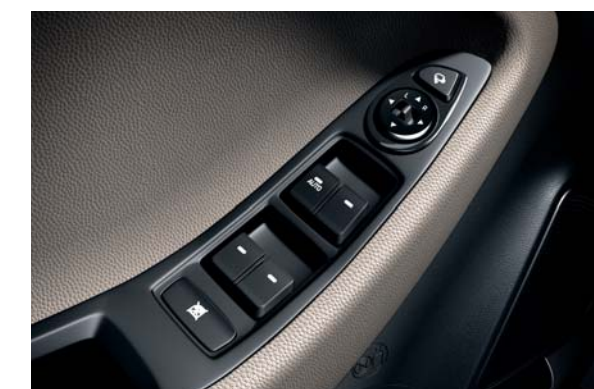
Elektricky ovládané okná vpredu a vzadu. Všetky bočné okná sa dajú ovládať elektricky. Predné okná majú funkciu ovládania jedným dotykom.

Pozrite sa na stranu 33 na kompletný prehľad farebných kombinácií karosérie a interiéru, ktoré sú k dispozícii.