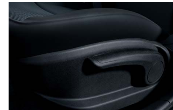
Výškovo nastaviteľné sedadlo vodiča. Svoju polohu za volantom si môžete optimalizovať aj výškovým nastavením sedadla.