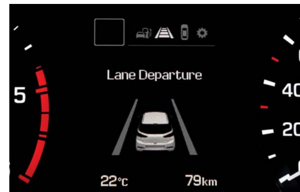
Lane Departure Warning System. Upozorní vodiča najprv vizuálne a potom akusticky, ak má vozidlo tendenciu opustiť jazdný pruh bez zapnutých smerových svetiel.