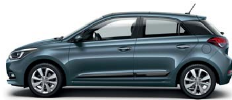
Aqua Sparkling metalická