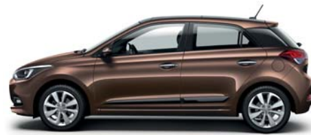
Cappucino Brown metalická