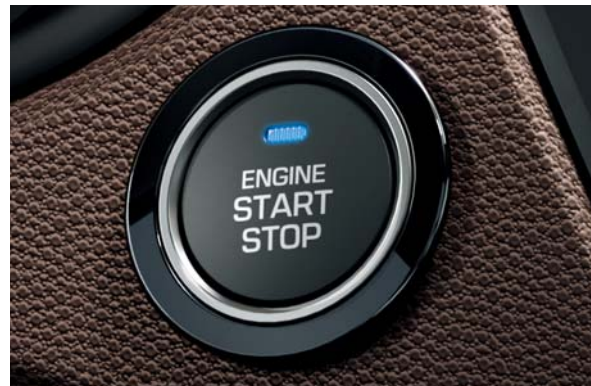
Tlačidlo na štartovanie/vypínanie motora. Motor môžete pohodlne naštartovať tlačidlom, ak máte elektronický kľúč smart key pri sebe vo vrecku alebo v taške.