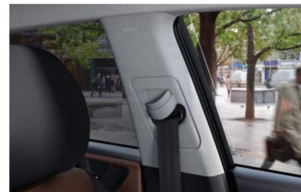
Výškovo nastaviteľné bezpečnostné pásy. Horná montážna úchytka bezpečnostných pásov predných sedadiel sa dá výškovo nastavovať na zvýšenie bezpečnosti a komfortu.