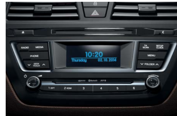
Audiosystém. Rádio RDS s prehrávačom CD/MP3 a s modulom Bluetooth. Systém sa dá ovládať aj tlačidlami na multifunkčnom volante. Značka Bluetooth je vlastníctvom Bluetooth SIG Inc.

Celý interiér je vypracovaný zo starostlivo vybraných látok a materiálov, ktoré na vás zapôsobia vysokou kvalitou a perfektnou presnosťou. Celkovým prostredím v kombinácii s úrovňou vybavenia je nový Hyundai i20 jedinečný vo svojej triede. K osobitným prvkom patrí držiak smartfónu na hornej ploche prístrojového panelu, vyhrievaný volant a navigačný systém so 7-palcovým (17,8 cm) dotykovým monitorom a s integrovanou cúvacou kamerou. Jednotlivé prvky môžu byť štandardné alebo na želanie – podľa stupňa výbavy.