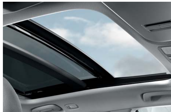
Panoramatická strecha. Interiér modelu i20 môže byť ešte svetlejší a vzdušnejší vďaka jedinečnej panoramatickej streche s možnosťou otvárania a vďaka priestranosti, ktorá v danej triede nemá konkurenciu.