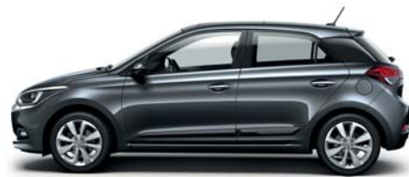
Star Dust metalická