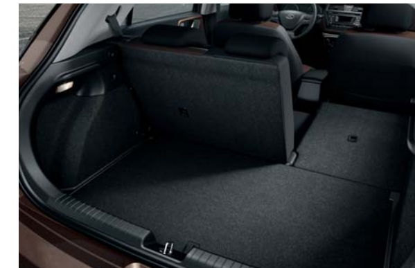
Delené operadlo zadného sedadla. Sklopné operadlo zadného sedadla je delené v pomere 60 : 40 na zvýšenie variability batožinového priestoru.

Čokoľvek potrebujete previezť, váš nový Hyundai i20 vám to svojou variabilitou umožní. Batožinový priestor so základným objemom na špičke triedy 326 litrov sa dá sklopením operadiel zadných sedadiel zväčšiť na 1042 litrov. Dno batožinového priestoru sa dá umiestniť do dvoch úrovní podľa potreby a v kabíne je množstvo praktických odkladacích priestorov.