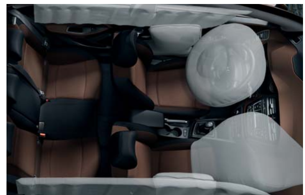
6 airbagov. Ochrana zo všetkých strán s 2 čelnými, 2 bočnými a s 2 bočnými závesovými airbagmi.