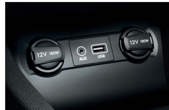
Vstupy Aux a USB. Na jednoduché pripojenie vášho smartfónu alebo prehrávača MP3 k audiosystému.