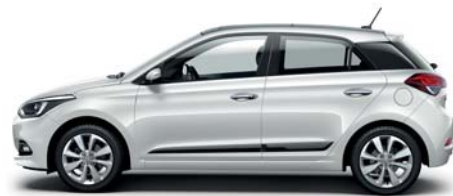
Polar White pastelová