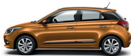
Mandarin Orange perleťová