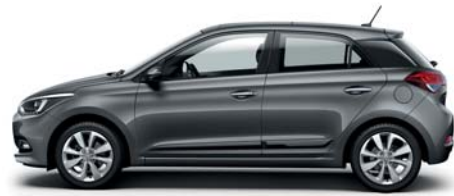
Baby Elephant pastelová