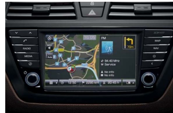
Integrovaný navigačný systém. Jednoduché a pohodlné ovládanie prostredníctvom dotykového monitora s veľkou uhlopriečkou 7 palcov (17,8 cm).