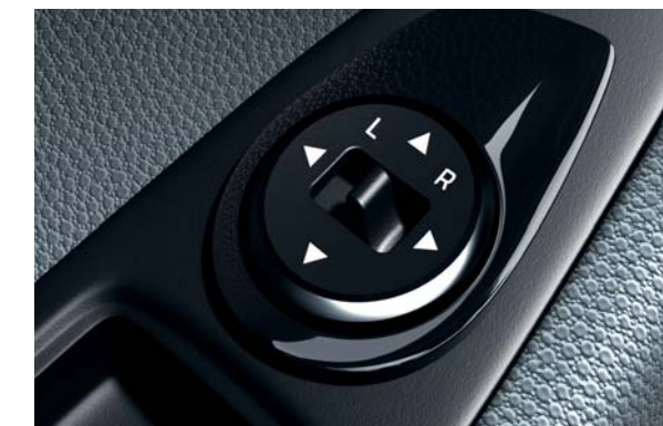
Elektricky ovládané a vyhrievané vonkajšie spätné zrkadlá. Vonkajšie spätné zrkadlá sa dajú nastavovať a vyhrievať ovládačom na konzole dverí.