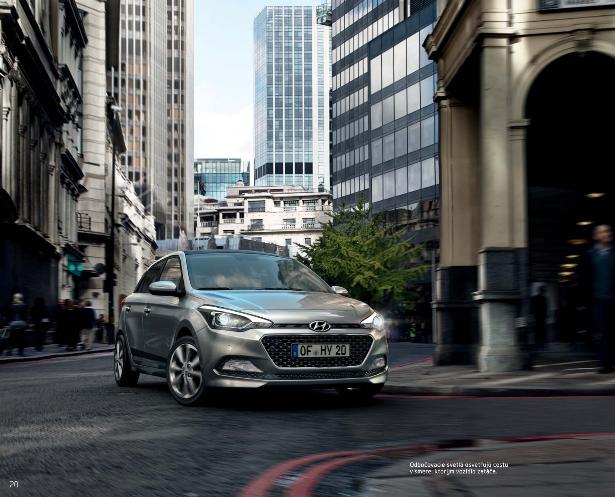
Odbočovací svetlá osvetľujú cestu v smere, ktorým vozidlo zatáča.