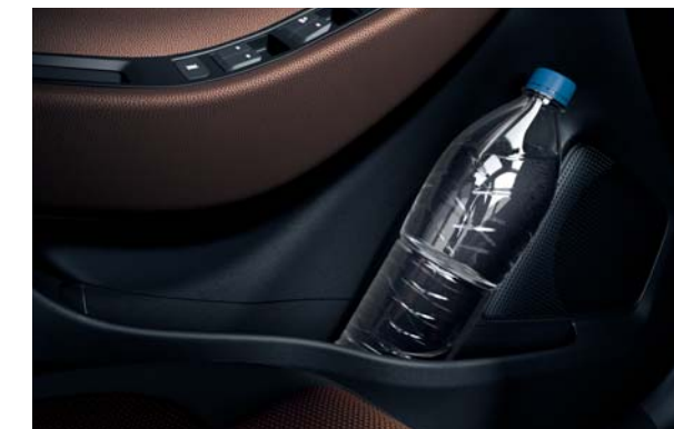
Odkladacie priestory na fľaše vo dverách. Fľaše s objemom 1,5 litra sa dajú bezpečne uložiť do priestorov v predných dverách, v zadných dverách je miesto na fľaše s objemom 1 liter.

Pri sklopených zadných operadlách vytvára dno batožinového priestoru v zvýšenej polohe rovnú plochu na pohodlné nakladanie batožiny.