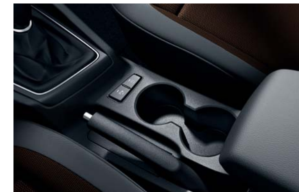
Držiaky na nápoje. Umiestnené v pohodlnom dosahu medzi prednými sedadlami.