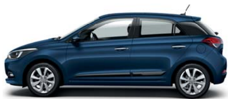
Morning Glory pastelová