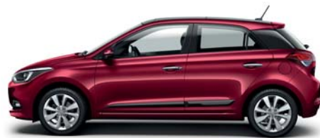
Red Passion perleťová