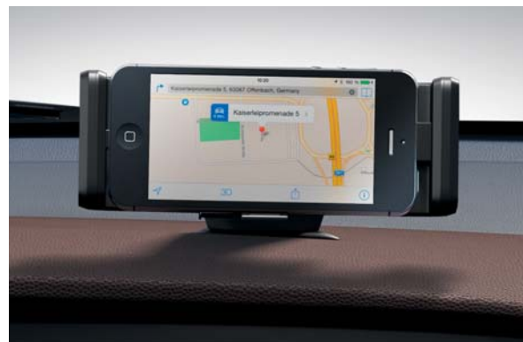
Dokovacia stanica na prístrojovej doske. Dokovacia stanica na smartphone bezpečne drží vaše zariadenie počas nabíjania batérie a je v perfektnej pozícii pre použitie telefónu ako navigácie, alebo na prehrávanie vašej obľúbenej hudby cez Bluetooth.