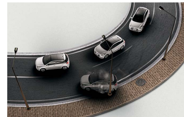
Electronic Stability Control. Spolupracuje so systémom Vehicle Stability Management na zabezpečenie trakcie a ovládateľnosti predovšetkým na povrchu so zlou adhéziou.

A my máme radosť z toho, že môžeme do tohto segmentu trhu priniesť viac bezpečnosti. Preto je karoséria vyrobená z ocele ultra vysokej pevnosti. Okrem dažďového a svetelného senzora môže mať nový Hyundai i20 aj odbočovacie svetlá, Lane Departure Warning System a Tyre Pressure Monitoring System.