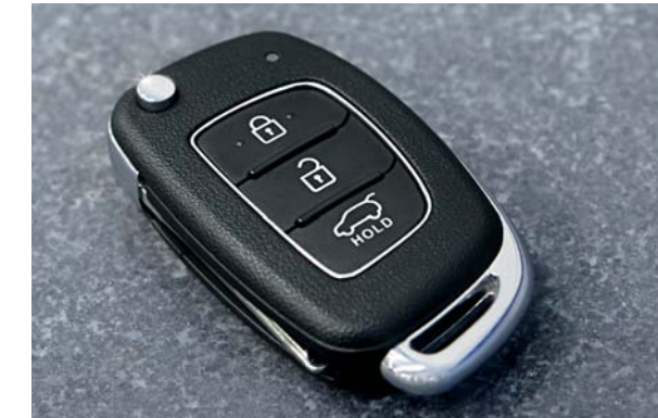
Diaľkové ovládanie centrálneho zamykania. Dvere kabíny a batožinového priestoru sa dajú zamknúť a odomknúť tlačidlami na kľúčí.