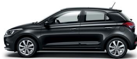
Phantom Black perleťová

Sme rozdielni a všetci máme vlastné preferencie a priority. Preto je Hyundai i20 k dispozícii so širokou ponukou farieb karosérie, ktoré dopĺňajú 4 farebné varianty interiéru. Potom môžete svojmu automobilu dodať osobný akcent výberom vybavenia na želanie a príslušenstva. Váš predajca Hyundai vám pri tom rád poradí a pomôže.