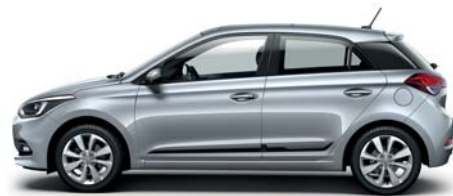
Sleek Silver metalická