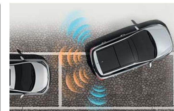
Parkovacie senzory. Zadné parkovacie senzory uľahčujú zaparkovanie v stiesnenom priestore.