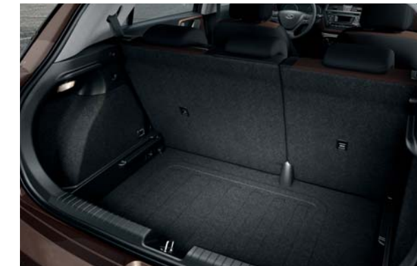
Nastaviteľné dno batožinového priestoru. Dno batožinového priestoru sa dá umiestniť v 2 rozličných výškach, aby sa podľa potreby vytvorila buď rovná podlaha pri sklopených zadných operadlách, alebo hlbší batožinový priestor.