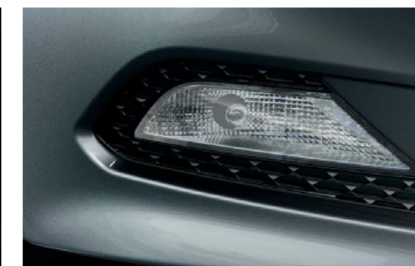
Predné reflektory do hmly. Pridavné svetlá zlepšujú osvetlenie cesty v hmle, hustom daždi a v snežení.