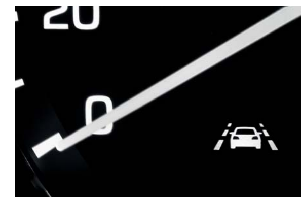
Lane Departure Warning System. Upozorní vodiča najprv vizuálne a potom akusticky, ak má vozidlo tendenciu opustiť jazdný pruh bez zapnutých smerových svetiel.