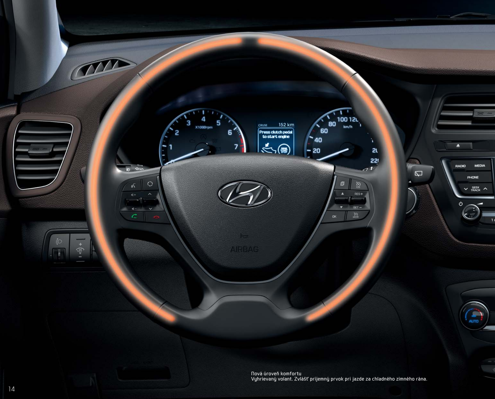
Nová úroveň komfortu Vyhrievaný volant. Zvlášť príjemný prvok pri jazde za chladného zimného rána.