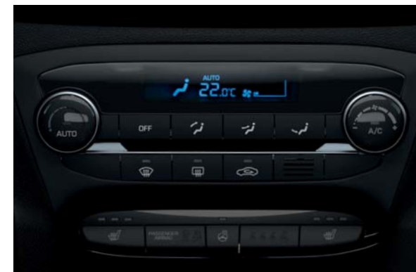
Automatická klimatizácia. Nastavte si vašu preferovanú teplotu a systém sa postará o ostatné. Funkcia automatického osušania udržiava vo vlhkom počasí priehľadné okná.