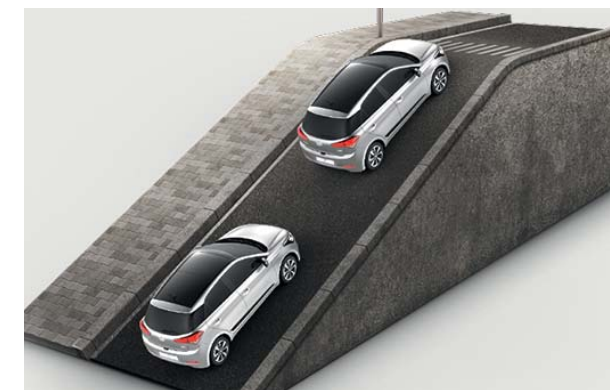
Hill Start Assist Control. Zabraňuje neúmyselnému pohybu vozidla dozadu pri rozjazde do svahu.