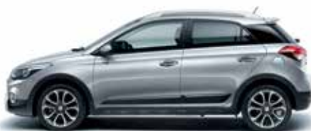
Sleek Silver metalická