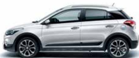
Polar White pastelová

Každý z nás je iný a má vlastné preferencie a priority. Hyundai i20 Active je k dispozícii v širokej palete farieb karosérie, ktoré umocňujú jeho dobrodružného ducha. Na výber sú štyri farebné varianty interiéru a jedinečná kombinácia s kontrastnými prvkami vo farbe Tangerine Orange. Ďalší individuálny charakter môžete svojmu vozidlu dodať prvkami vybavenia na želanie a originálnym príslušenstvom.