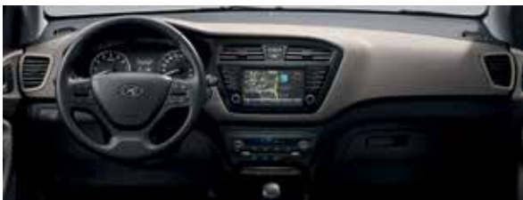
Farebná úprava Elegant Beige