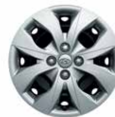
15-palcové ocel'ové disky