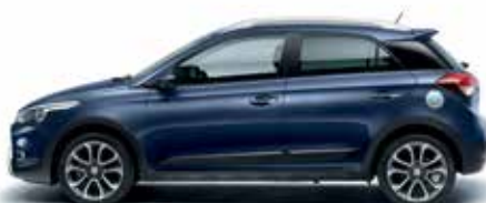
Morning Blue metalická