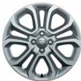
17-palcové zliatinové disky