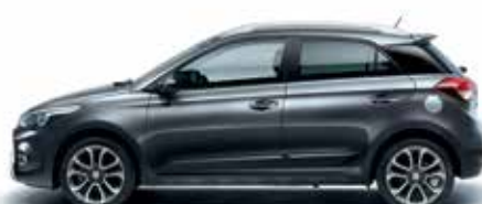
Star Dust metalická