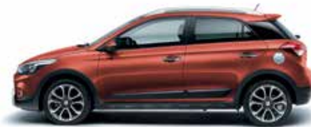
Tangerine Orange metalická