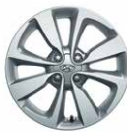
16-palcové zliatinové disky