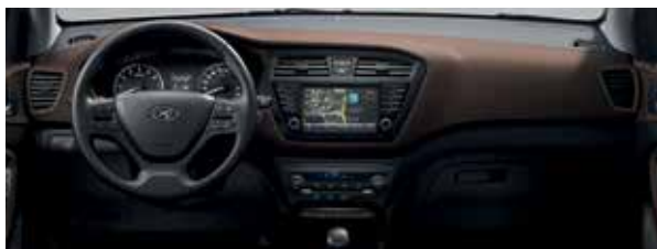
Farebná úprava Cappuccino