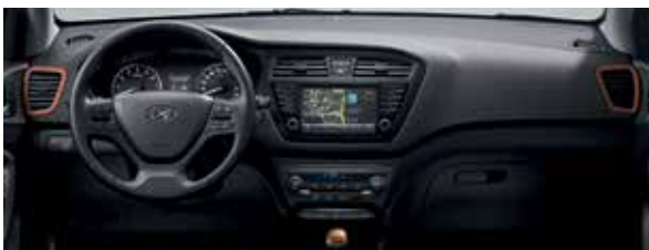
Komplet Colour Pack dodáva interiériu oranžové akcenty*