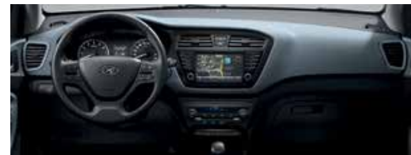
Farebná úprava Grayish Blue