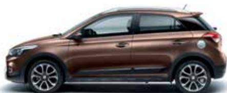
Iced Coffee metalická