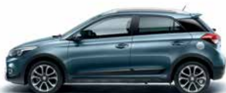
Aqua Sparkling metalická