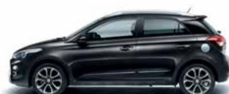
Phantom Black perleťová