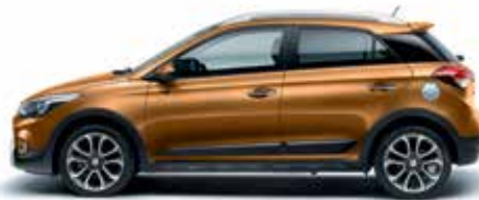
Mandarin Orange perleťová