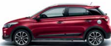
Red Passion perleťová