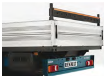
Zadný demontovateľný rám s otvormi pre fixáciu nákladu s max. zaťažiteľnosťou 300 kg.