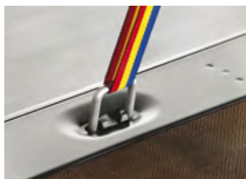
Kotviace oká DIN 75410.