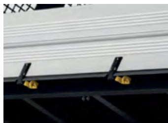
Drážka v bočnici a háky pod príviesom pre uchytienie plachty či fixačných pásov.