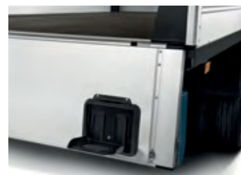
Integrovaný schodík v zadnom paneli.