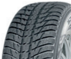
WR SUV 3