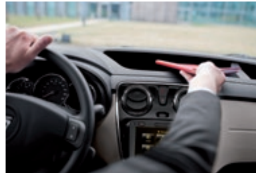
Praktický interiér ponúka mnoho odkladacích priestorov.