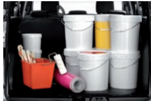
Nákladový priestor s objemom 800 litrov.