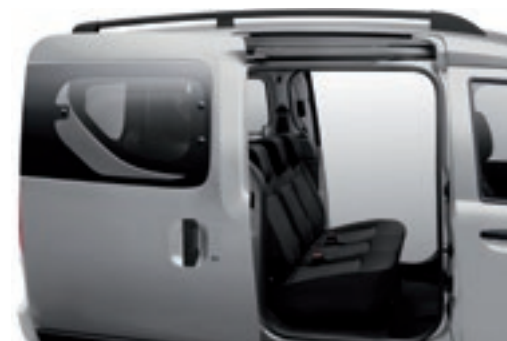
Posuvné bočné dvere*.