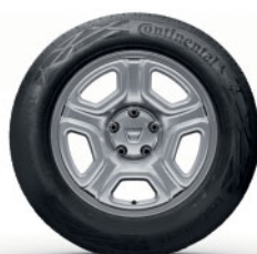
OCELOVÉ OZDOBNÉ KOLESÁ 16", DESIGN FIDJI