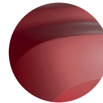
ČERVENÁ FUSION (2)