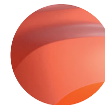
ORANŽOVÁ ARIZONA (2)