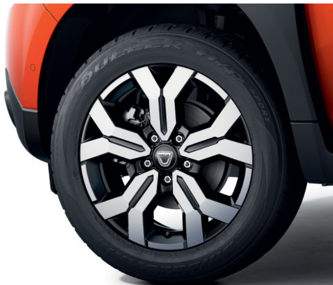
DISKY KOLIES 17"

máha znížiť emisie CO 2 a zvýrazňuje dynamický vzhľad karosérie. Nový dizajn kolies rovnako ako nová farba oranžová Arizona lákajú k novému dobrodružstvu.