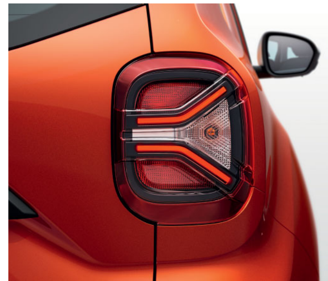
SVETELNÝ PODPIS V TVARE Y