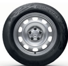
OCELOVÉ KOLESÁ 16"