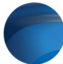
MODRÁ IRON (2)