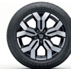
DISKY KOLIES Z LAHKÝCH ZLIATIN 17", DESIGN TERGAN