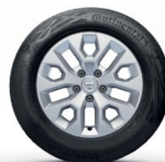
DISKY KOLIES Z LAHKÝCH ZLIATIN 16", DESIGN ORAGA