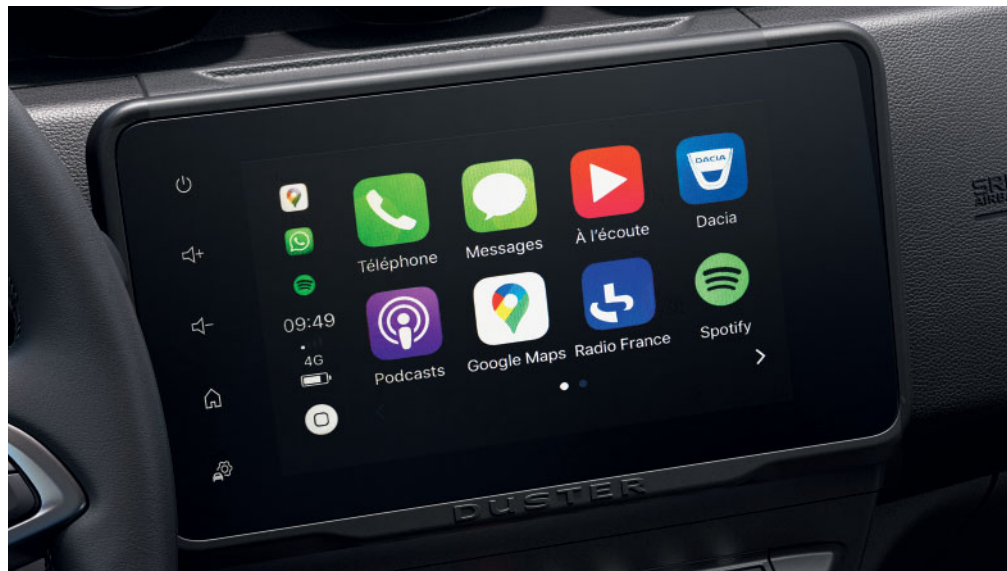
ZRKADLENIE SMARTFÓNU CEZ APPLE CARPLAY ALEBO ANDROID AUTO NA 8" DISPLEJI