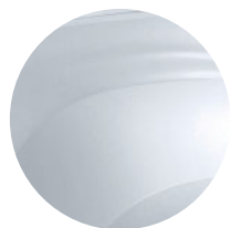
BIELA GLACIER (1)