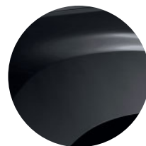
ČIERNÁ NACRÉ (2)