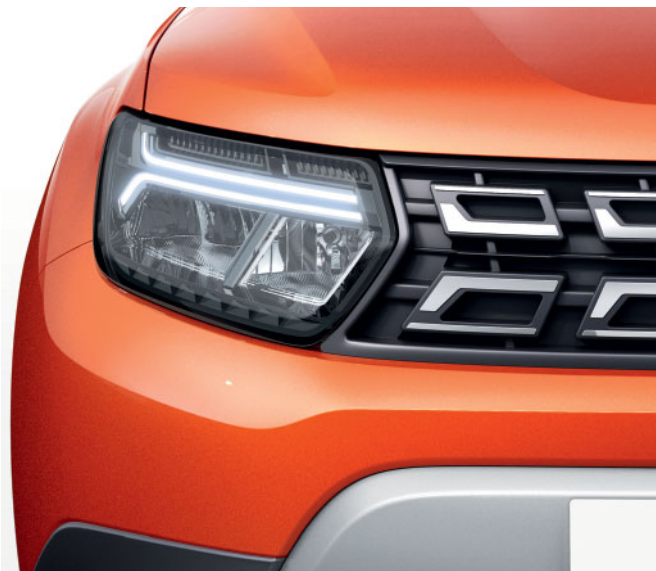
NOVÁ PREDNÁ ČASŤ