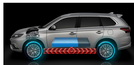
Paralelný hybridný režim

Kolesá sú poháňané elektromotormi. Pri potrebe vyššieho výkonu sa k batérii pohonu pridá aj elektro generátor poháňaný spaľovacím motorom. Pri vybití batérie pod určitú hodnotu sa generátor pripája skôr. Režim je vhodný pre rýchlu akceleráciu vozidla alebo pre náročné stúpania.