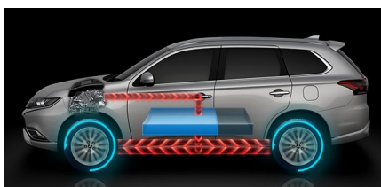
Sériový hybridný režim

Elektromotory poháňajú vozidlo pomocou elektriny z batérie, čo znamená nulovú spotrebu paliva a jazdu úplne bez emisií CO 2 . Režim EV je synonymom pre úplné ticho, vysokú účinnosť prenosu energie na kolesá a výkon. V tomto režime dosahuje najvyššiu rýchlosť 135 km / h.