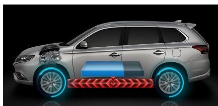
Jazdný režim EV

Elektromotory poháňajú vozidlo pomocou elektriny z batérie, čo znamená nulovú spotrebu paliva a jazdu úplne bez emisií CO 2 . Režim EV je synonymom pre úplné ticho, vysokú účinnosť prenosu energie na kolesá a výkon. V tomto režime dosahuje najvyššiu rýchlosť 135 km / h.