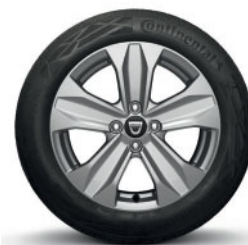
16" DISKY ARAMIS

(1) Štandardná farba, (2) Metalická farba.