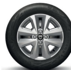
15" FLEXWHEEL SORANE