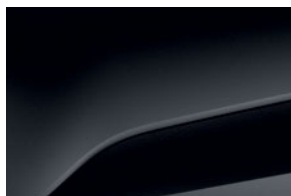
ČIERNÁ NACRÉ (2)