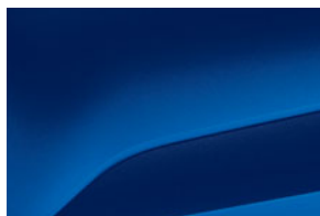
MODRÁ IRON (2)