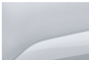
BIELA GLACIER (1)