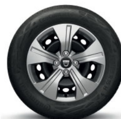
15" KRYT KOLESÁ ELMA