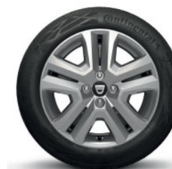
16" FLEXWHEEL SARIA, SVETLO SIVÝ