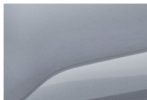
SIVÁ HIGHLAND (2)