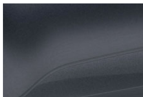
SIVÁ COMETE (2)