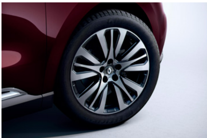
19" disky kolies z ľahkých zliatin, dizajn Initiale Paris