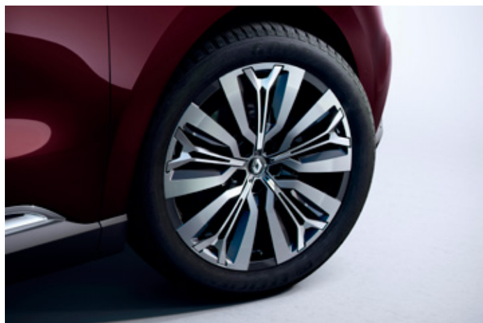
20" disky kolies z ľahkých zliatin, dizajn Initiale Paris