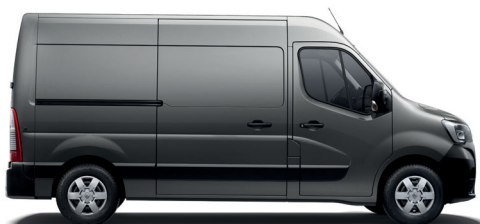
Furgon s predným pohonom

Máte široký záber rôznych potrieb, ktoré dokáže naplniť pestrá ponuka interiérových prvkov a kombinácií dĺžky a výšky nového vozidla Renault MASTER s nákladovým priestorom s objemom 8 až 17 m 3 .