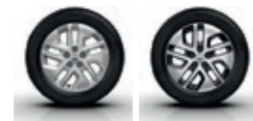
Disky kolies z ľahkých zliatin 17", dizajn Cyclade